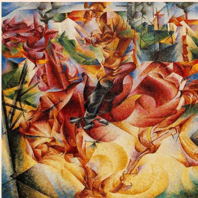
Умберто Боцони, футуризам

Футуристе је импресионирала физичка снага, моћ, енергија, агресивност и на бизаран начин их је надахњивала идеја о рату као „јединственој хигијени света“ . Истицали су супериорност мушкарца, величали „лепоту борбе“, ниподаштавали значај културних институција (школа, музеја, библиотека...) и пропагирани милитаризам. Њихове идеје послужиле су као уметничко поткрепљење фашистичког покрета у Италији.