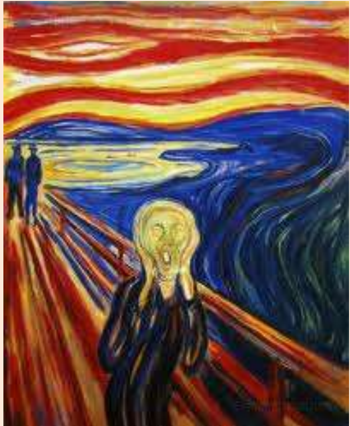
„Крик“, Едуарда Мунка

Експресионизам се првобитно појављује у Француској ( фовизам ) као уметнички одговор на импресионистичко сликарство које су нови уметници сматрали млаким и неусклађеним са истинским доживљајем новог века. Нова историјаска епоха најављивала је кошмаре и трауме, а импресионисти су задржавали емоционалну дистанцу према стварности која их је окруживала. Експресионисти су желели да изнесу на видело своје фрустрације, да се побуне и изразе свој лични став. Прави замах и потпун израз експресионизам добија у Немачкој одакле се ширио по остатку Европе. Символ експресионистичког сликарства, али и експресионизма као правца у целини је слика „Крик“, Едуарда Мунка. Крик је најадекватнија реч за именовање ужаса, доживљаја беде, беспомоћности, незадовољства младог човека у предвечерје рата и свих облика кризе који из њега проистичу.