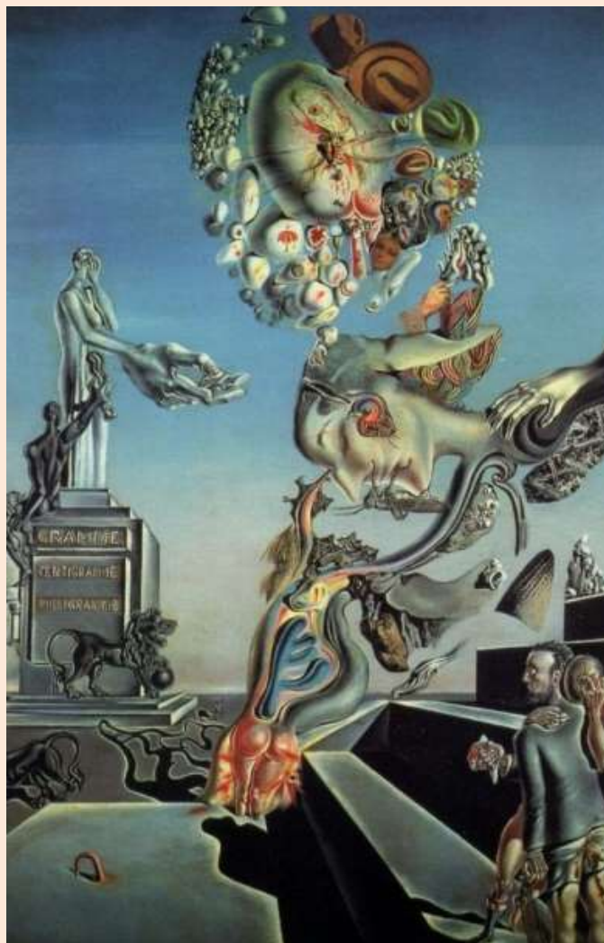
Салвадор Дали, надреализам

Веровали су да је то прави начин да се допре до скривених истина потиснутих у дубине људске подсвести. Прави природни и слободни човек изобличен је контролом, конвенцијама, нормама и зато их треба