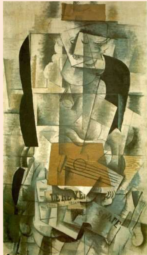
Жорж Брак, „Жена“

Међу књижевницима, кубизму су били наклоњени песници склони експериментима и изражавању у различитим медијима, али и различитим уметничким правцима, попут Жана Коктоа (песник, аликар, драматург, критичар уметности...)