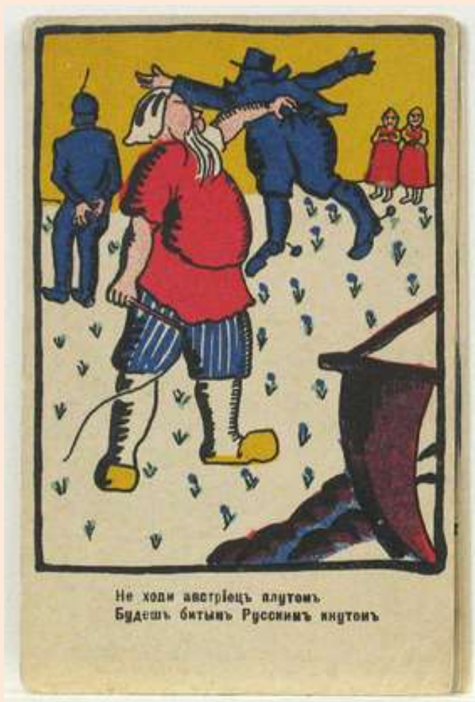
Плакат са стиховима Мајаковског

Осим футуризма, у Русији је у исто време постојао и покрет краћег даха и утицаја – имажинизам , коме је припадао песник Сергеј Јесењин .